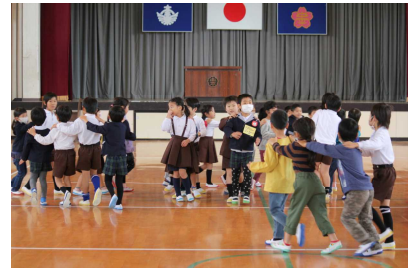
〈みんなでジャンケン列車!〉

2月8日(水)、来年度の新1年生が一日体験入学で来校しました。1年生は、自分たちより小さく幼い新1年生のために、ネームメダルを作ったり、楽しいレクリエーションの計画を立てたりなど、準備をしていました。当日、保育園や幼稚園とは違う雰囲気には最初は少し緊張気味の新1年生を中平っ子1年生たちが、いっしょうけんめい“おもてなし”。いつもよりちょっぴり頼もしいお兄さん、お姉さんぶりを発揮して、新1年生を笑顔いっぱいにしてくれました。4月の入学式でまた会えるのを楽しみに待っています。