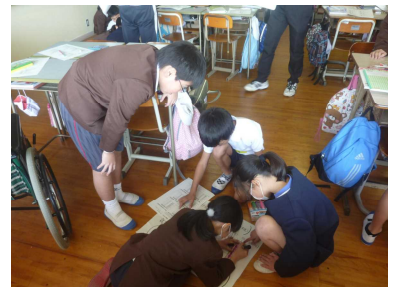
〈5年生算数：帯グラフ作り!〉