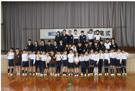
〈南種子っ子2年生全員集合!〉

南種子っ子たちが一堂に会しての集合学習・交流学習は、今年度3回目です。積み重ねを通して、一人一人の学習活動がたいへん意義あるものとなってきています。これからも、「ふるさと南種子に誇りをもち、自己実現を図る子供の育成」に向けて、中平小学校職員も南種子っ子たちと共に頑張っていきます。