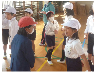
〈3年生：笑顔であいさつ!〉